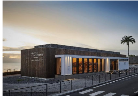
Visite du Musée Franck Perret Mémorial de la catastrophe de 1902