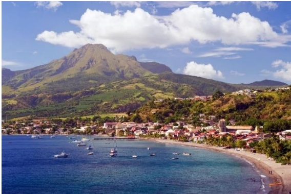
Visite de la Ville de Saint-Pierre