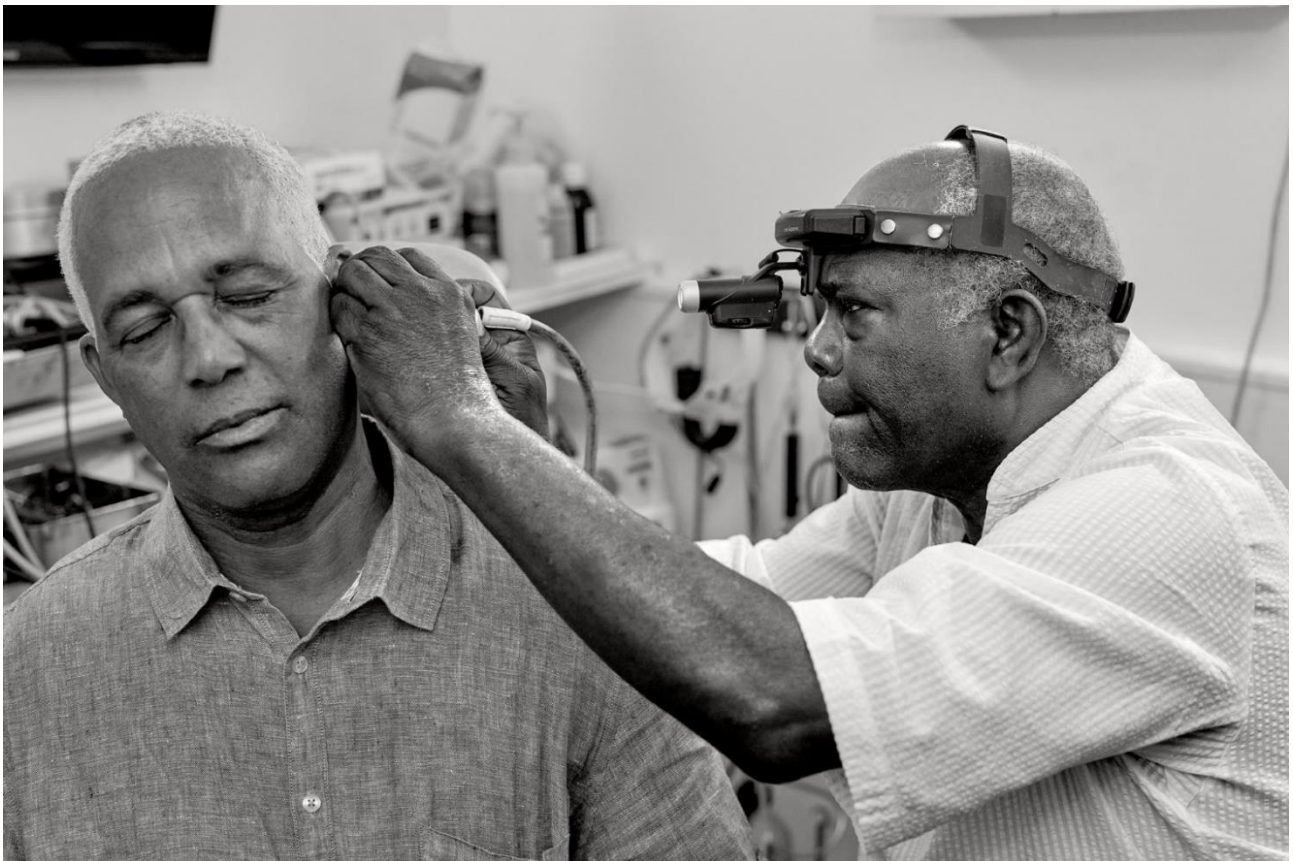
Consultation ORL aux Trois Ilets