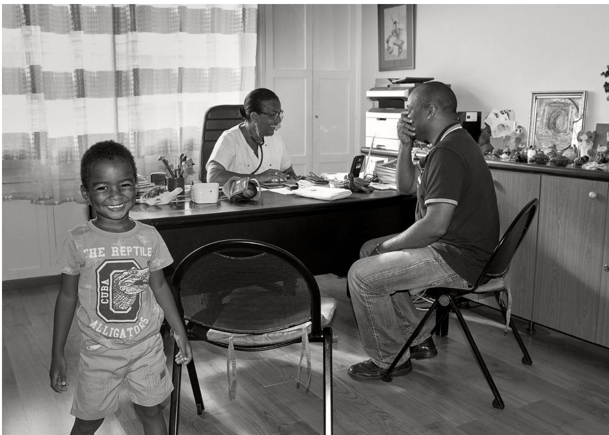
Consultation de médecine générale à Fort de France