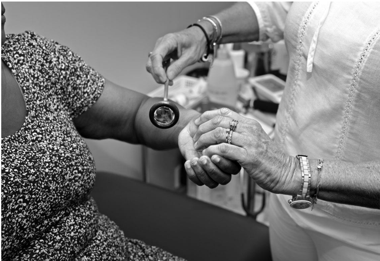
Consultation de médecine générale à Fort-de-France