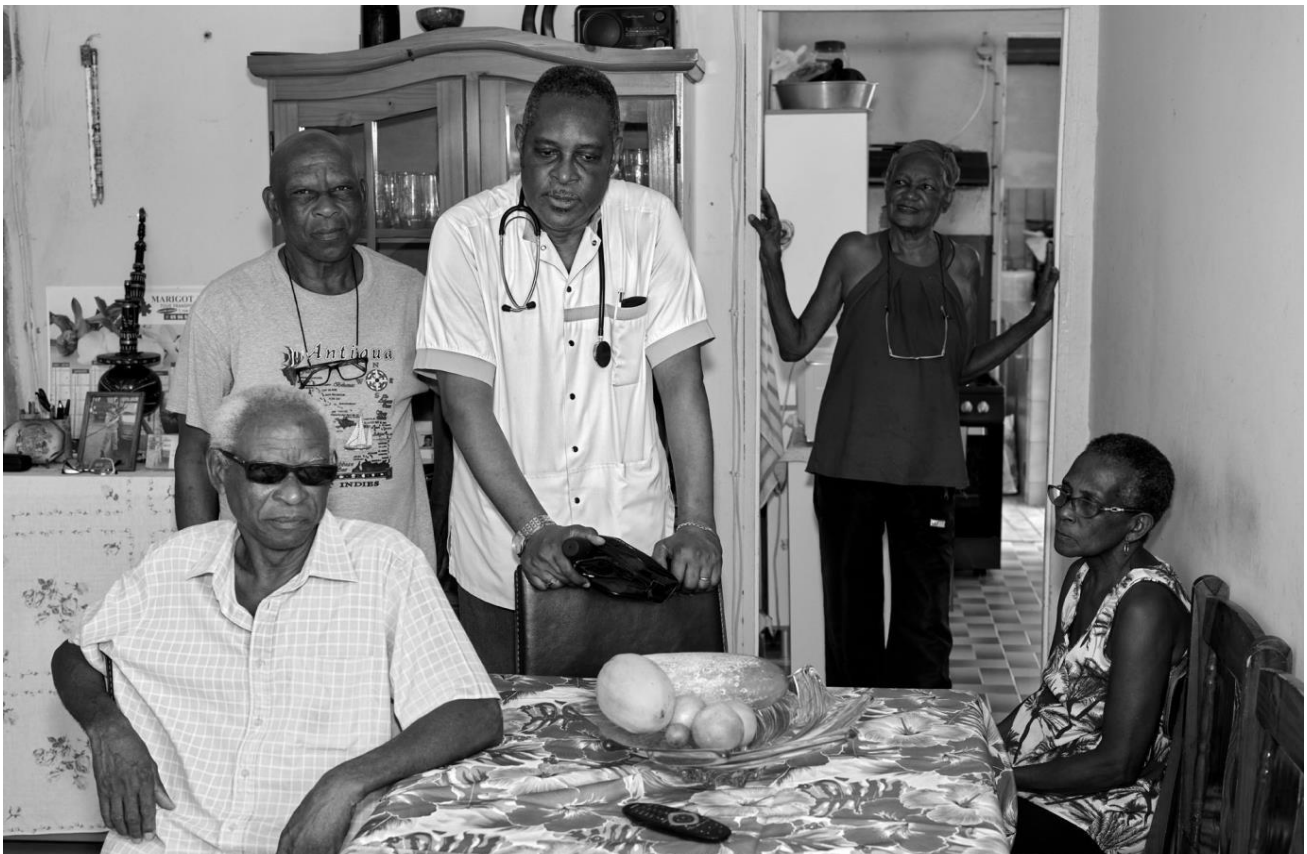
Médecin de famille en visite à domicile au Marigot