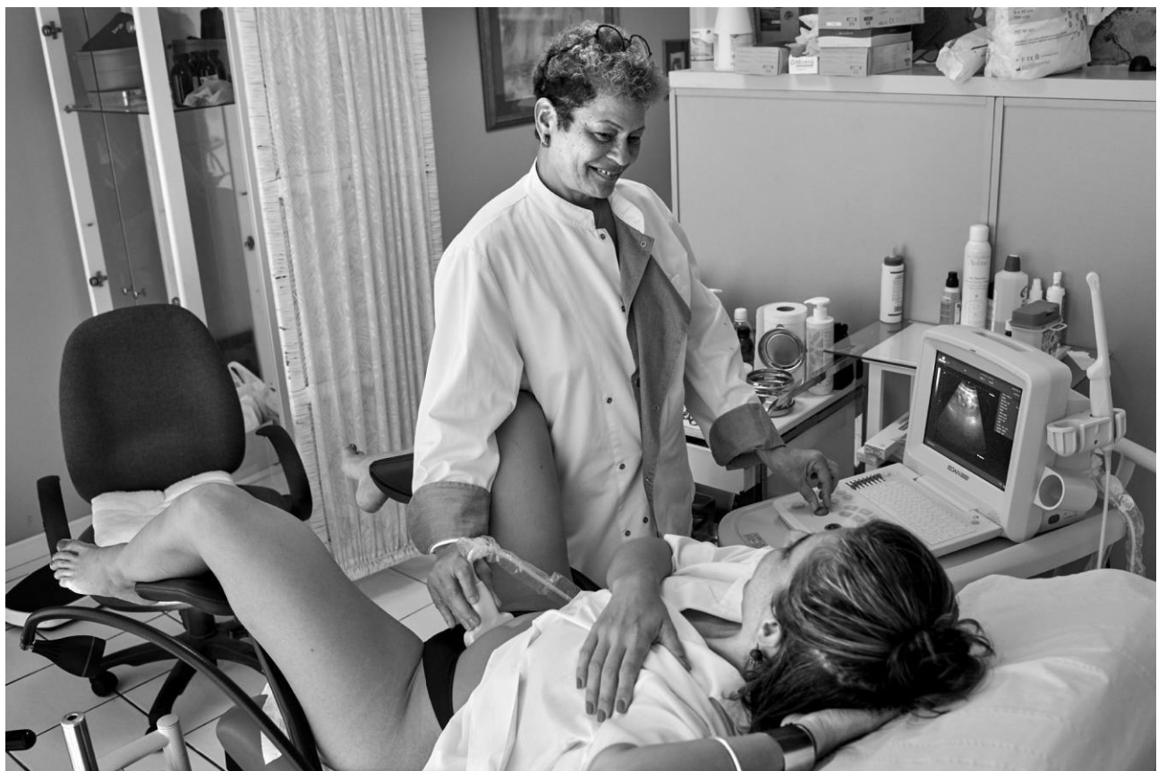
Consultation en gynécologie à Schoelcher