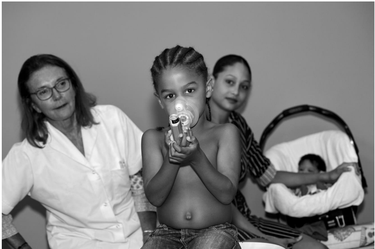
Consultation d'allergologie à Fort de France